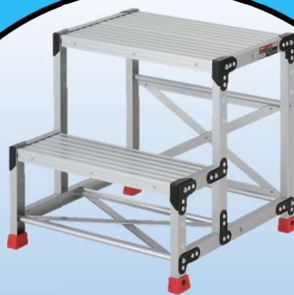
材料セット用 踏み台